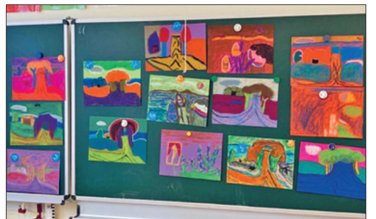
Text/Bilder: A. Schneider