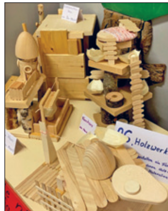
Text/ Bilder: A .Michael