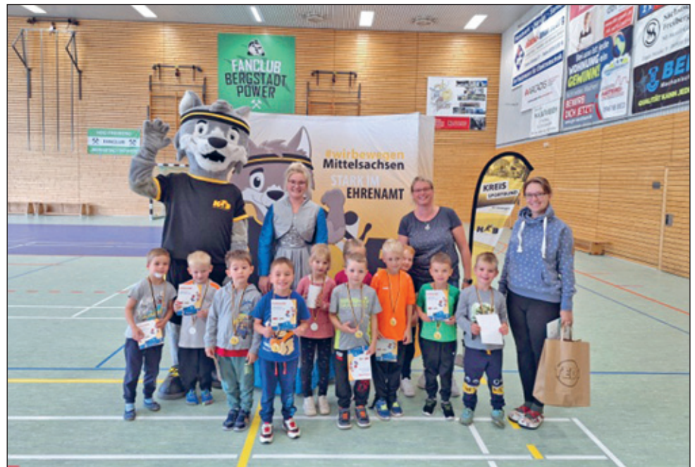
Team der Kita Wegefath