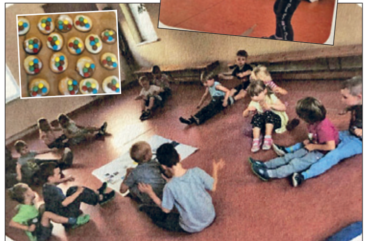
Unsere selbstgebackenen Medaillen ließen wir uns gut schmecken.

Mit einer Kinderolympiade schlossen wir unser Projekt ab und bekamen natürlich noch eine richtige Medaille.