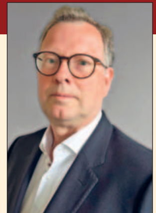
Rico Gerhardt, Bürgermeister